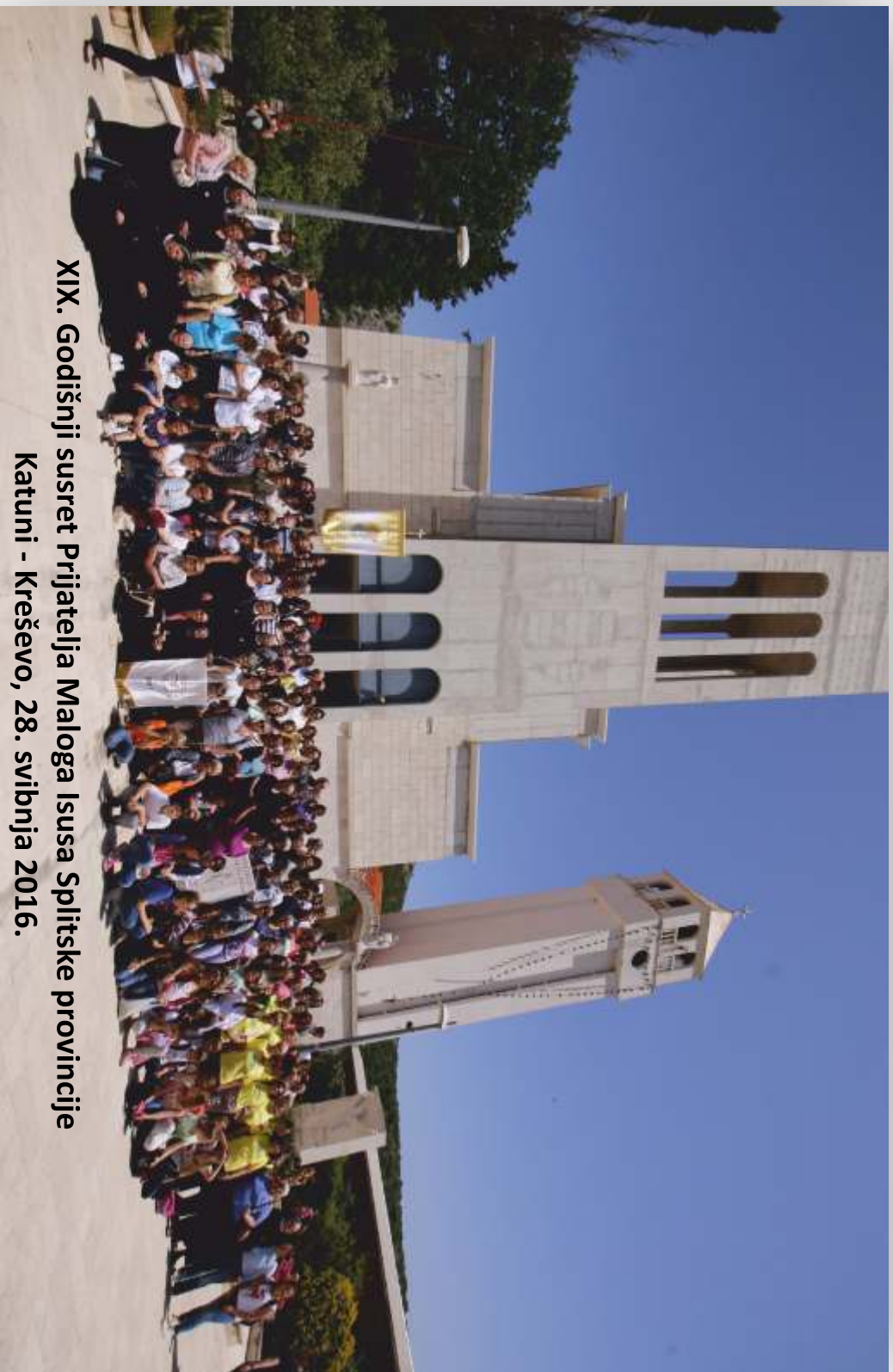
XIX. Godišnji susret Prijatelja Maloga Isusa Splitske provincije Katuni - Kreševo, 28. svibnja 2016.