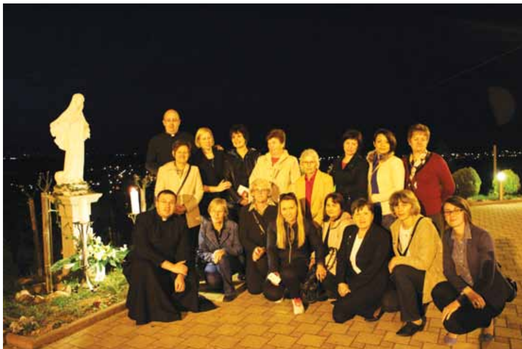
Prijatelji Maloga Isusa u župi Bistra