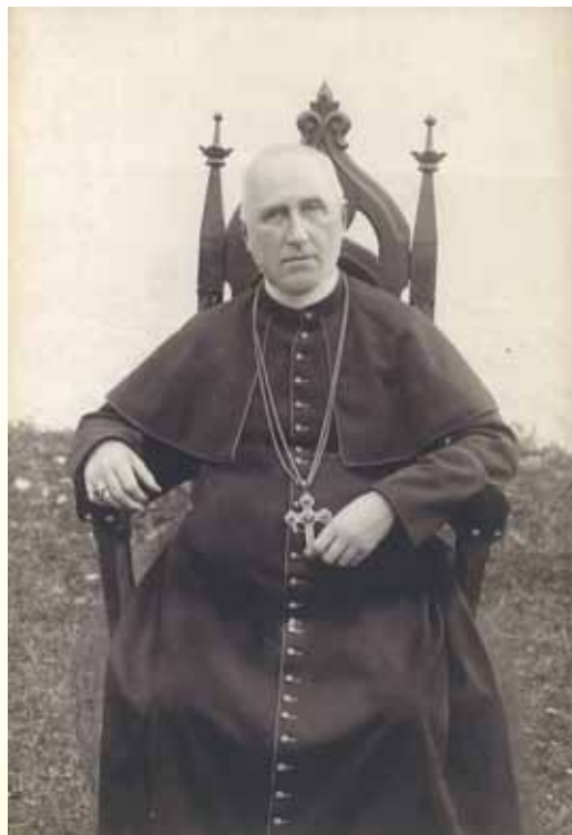
Nadbiskup dr. Josip Stadler

»Na povratku s Istoka stignem preko Trsta u Dubrovnik u nedjelju u jutro 19.