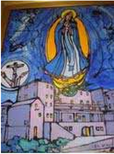
Slika Imakulete – J. Botteri

1934. god. ponovno vratile i nastanile u sadašnjoj kući na vrgorskoj pjaci.