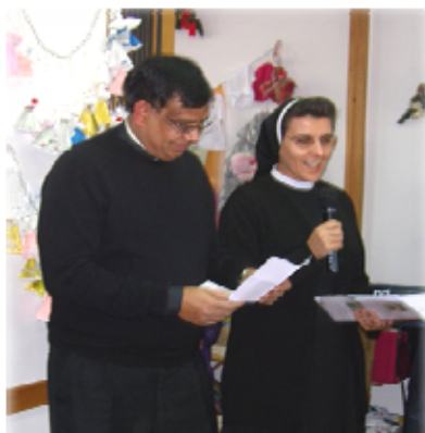
Mons. Joseph Arshad otvorio je misijsku izložbu

Izložbu je otvorio mons. Joseph Arshad, savjetnik u Apostolskoj nuncijaturi u Sarajevu. Tom prigodom nazočnima je približio život u misijskim područjima i duh Božića koji se očituje u radosnom dijeljenju dobara i solidarnosti s onima koji nemaju najpotrebnije za život. „Cijenim ovu Vašu misijsku zauzetost i osjećajnost. Vaše molitve i vaši financijski