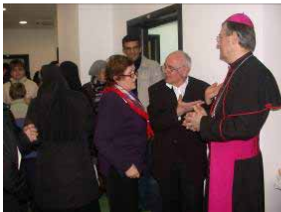
Nadbiskup M. Barišić u susretu s vjernicima

Od srca pozdravljam sve prisutne svećenike na čelu sa župnikom župe Vrgorac fra Petrom Vrljičkom, koji se skupa sa sestrama radovao da se u župi gradi novi samostan i dom, u neposrednoj blizini župske crkve.