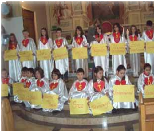
PMI – u svakom srcu po jedno slovo Stadlerova imena