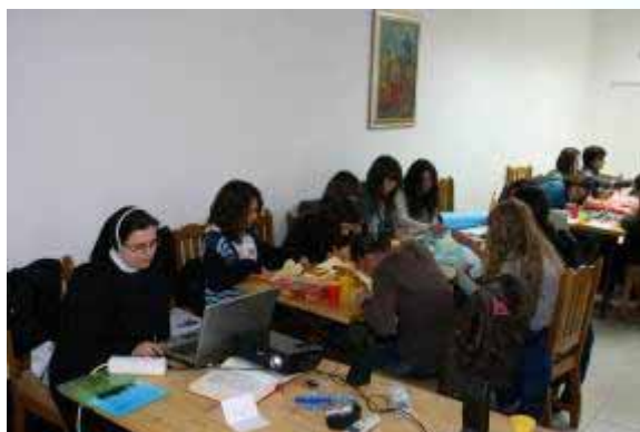
Djevojke sa s. Jelenom u radionici

Dopustimo da nas prožme ta Njegova bezuvjetna ljubav, da nam tom ljubavlju posreduje tako potrebne i neophodne životne sokove koji iz Njega struje i kolaju u naš život.