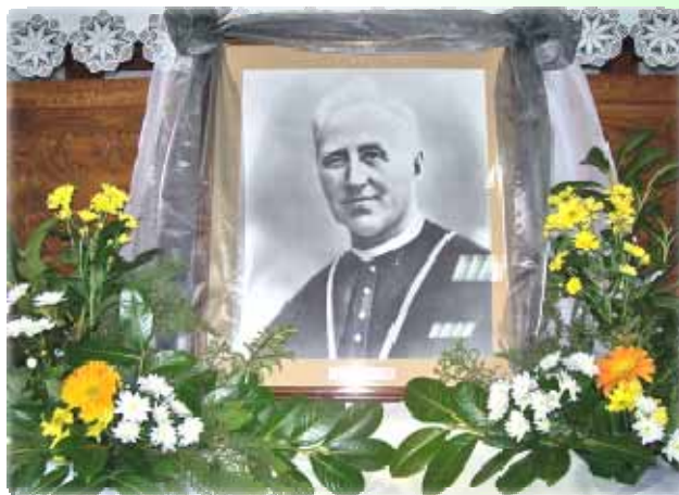
Pred oltarom okićena slika SB Josipa Stadlera

sva svoja djela. Poslije molitve i klanjanja slijedila je sveta misa s prigodnom propovijedi, u kojoj je istaknuta Utemeljiteljeva pobožnost i ljubav prema Srcu Isusovu.