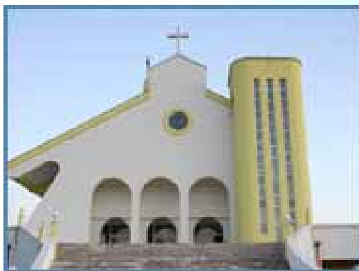
Župna crkva Sv. Nikole