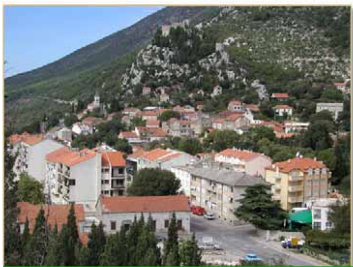
Vrgorac – grad na gori