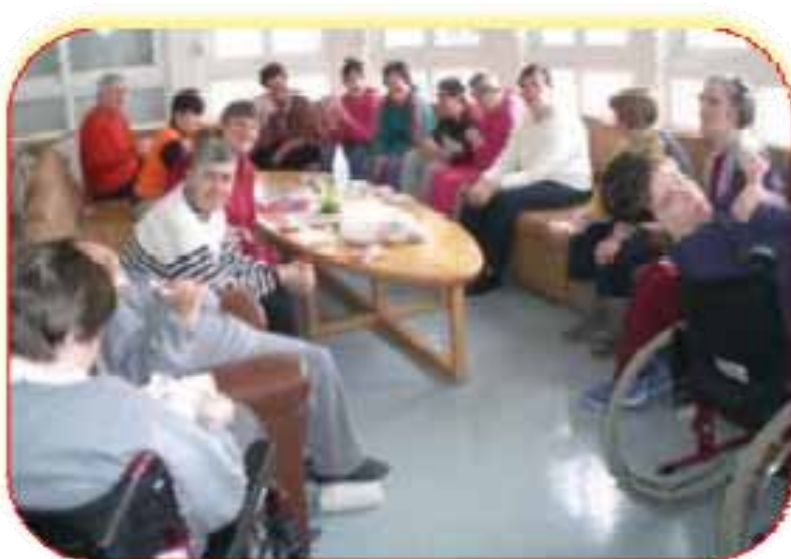
Naši štíćenici u zajednici u Solinu