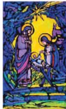
J. Bottleri, Božićni triptih

«Bog je pokazao svoje ljudsko lice u Djetetu. S njegova lica Božić je preplavio svako ljudsko liceu kojemu smijemo prepoznavati Boga!»