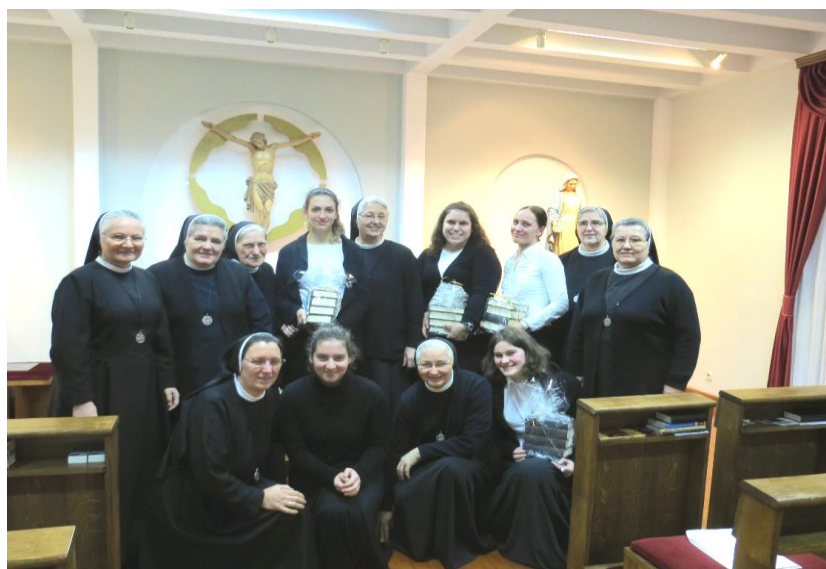
Zajednica sestara u samostanu sv. Ane u Splitu s postulanticama i kandidaticom