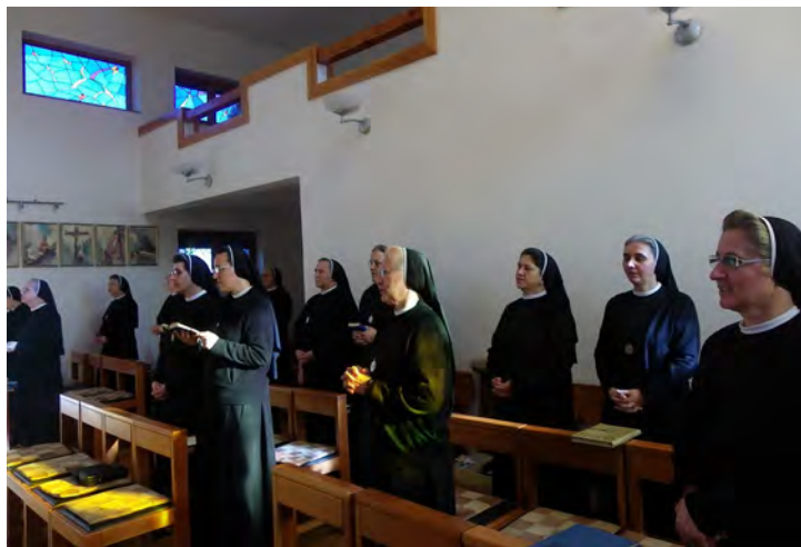
O dođi, Stvorče Duše Sveti !

Pozvavši sve, rekao je: idemo se staviti pod zaštitu Srca Isusova, idemo promisliti u čemu je to i idemo djelovati. Crkvi i ljudskom društvu nema spasa, jedino u Srcu našega Gospodina . Dakle, nije pesimist, nego hoće reći: Ako želimo pobijediti zlo, moramo zaći u dubinu! Ne možemo se zadovoljiti nekakvom površnom pobožnošću. Srce je nešto najdublje. Tu su naše najdublje misli, stradanja, očekivanja, čežnje. Moramo ići ravno do Božjega, dakle i svoga srca. I što je učinio Nadbiskup? On reče: Preuzeo sam novoustrojenu Vrhbosansku nadbiskupiju, preuzeo veliku odgovornost, veliki teret . A tko je čovjek srca, kao što je bio veliki Stadler – čovjek srca, ne može ostati samo na nekim pobožnim uzdasima. To mora biti čovjek koji preuzima odgovornost. Zašto? Ma zato, što ljubav priziva na odgovornost.