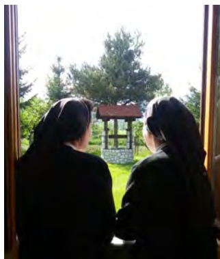
Pogled na Jakovljev zdenac