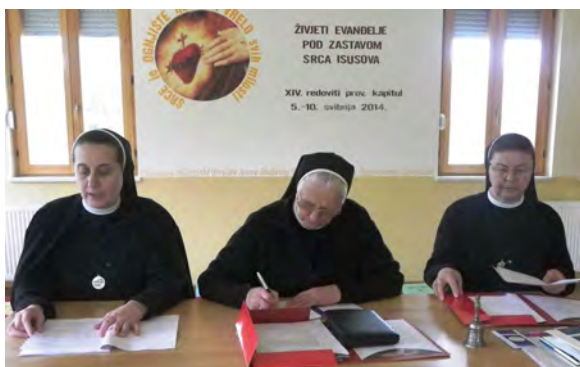
Izlaganja sestara daju smjernice našem pogledu i puti