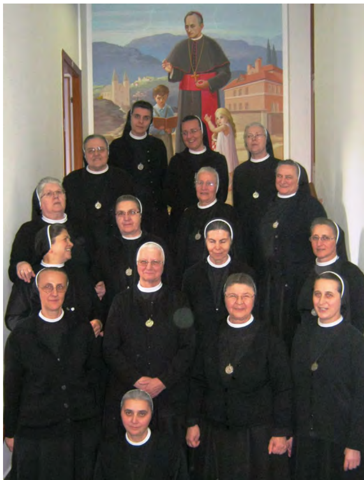
Pod Utemeljiteljevim okriljem