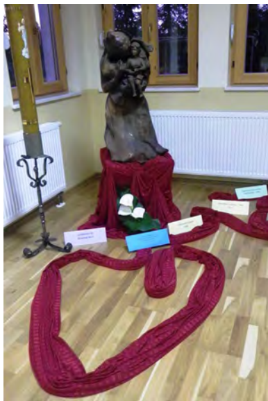
Iz Isusovog srca po Mariji nastajale su naše zajednice

va – izvoru svih milosti, zaštiti Bezgrješne Djevice Marije, našim nebeskim zaštitnicima, našem ocu Utemeljitelju, pokojnim sestrama koje su nam svojim životom svjedočile i prenijele u baštinu primljenu karizmu. Povjerimo naš rad i neumornim svjedocima radosnog navještaja Evandjelja širom svijeta, našim novim svecima papi Ivanu Pavlu II. i papi Ivanu XXIII.