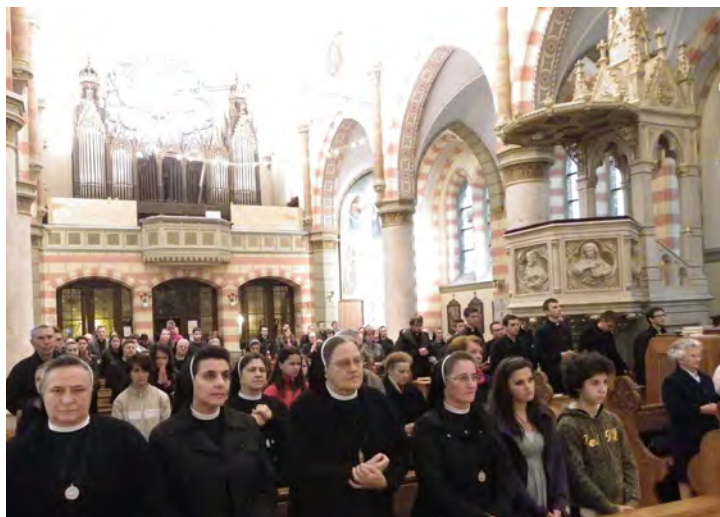
Molitva u katedrali na Utemeljiteljev dan