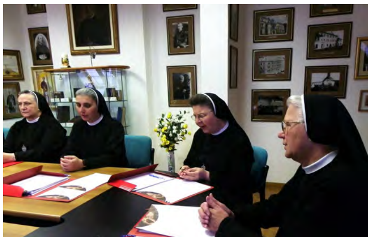
Nadahnuće Utemeljiteljeva prstena

riti Kardinal – u koncelebraciji većeg broja svećenika i Prijatelja Maloga Isusa. U prigodnoj propovijedi Kardinal je govorio o sluzi Božjemu nadbiskupu Stadleru – ističući da se želimo i trebamo istinski nadahnjivati čovjekom koji je udario temelje Vrhbosanske nadbiskupije i u njoj osnovao Družbu sestara Služavki Maloga Isusa. Na kraju misnoga slavlja svi smo se okupili na grobu oca Utemeljitelja te izmolili molitvu za njegovo proglašenje blaženim. Nakon toga je Kardinal svima podijelio misni blagoslov, a sestre su u tišini nastavile moliti i zahvaljivati velikanu uma i srca, ocu i majci bosanske sirotinje i na tom, za nas sestre svetome grobu, oslušivati nova nadahnuća za nove iskorake u življenju, svjedočenju i naviještanju Evanđelja. Po izlasku iz katedrale, sve nazočne sestre i Prijatelji Maloga Isusa, napravili smo zajedničku fotografiju pred nedavno postavljenim kipom velikoga pape Ivana Pavla II. Tako je završio i treći dan Kapitula.