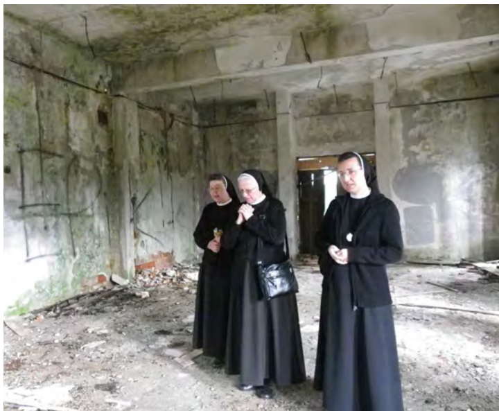
Sjećanje na naš prvi kapitul provincije u dvorani u Ljubljanskoj ulici

Dan duhovne obnove završile smo u 18:00 sati, svečanom Večernjom molitvom i Euharistijskim slavljem zahvale za udijeljene milosti.