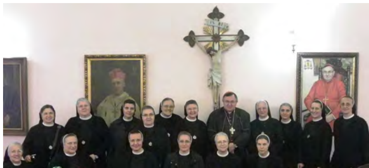
Pohod kardinalu Vinku, nadbiskupu Puljiču