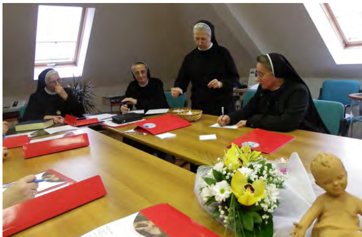
Skrutatorice na zadatku

Po svršetku svih Izvješća uslijedila je kratka stanka, poslije koje su se sestre kapitularki zaputile u kapelicu da bi dan završile zahvalom Gospodinu za udijeljene milosti svečanom Večernjom molitvom Crkve.