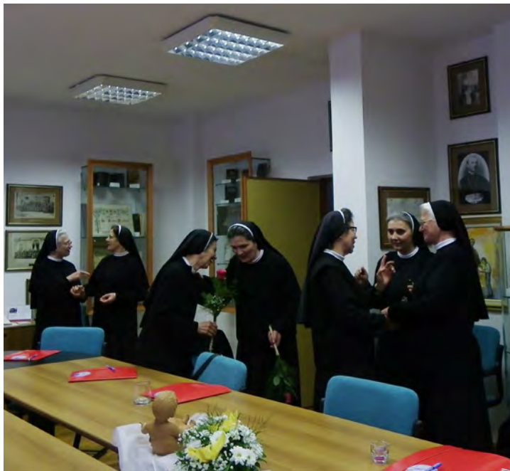
Radujemo se s vama drage sestre