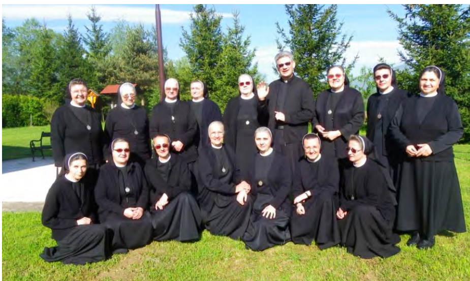
Sestre sudionice provincijskog kapitula s voditeljem duhovne obnove

Poslijepodnevna meditacija je započela u 16:00 sati na temu Posvetiti druge svojom posvećenošću . Da bismo drugima navijestili Krista, sami moramo biti evangelizirani. Svatko od nas mora čuti Božju Riječ, poslušati Božju Riječi, dati se voditi Božjom Riječju. Trebamo se najprije sami posvetiti da bismo drugima mogli svjedočiti.