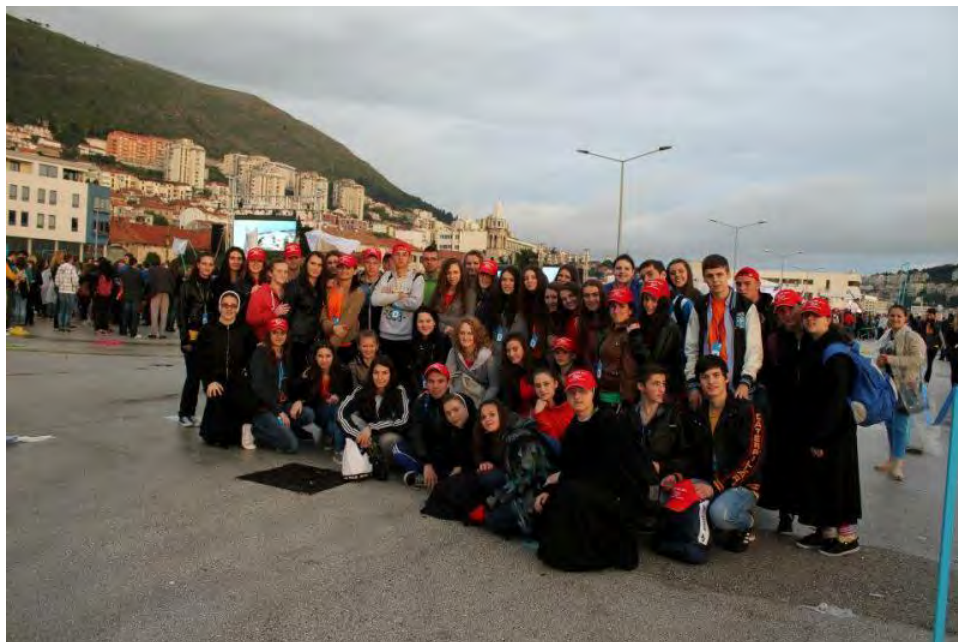
Mladi iz Sarajeva u Dubrovniku na susretu HKM 2014.