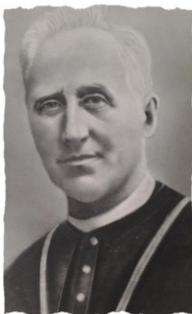
Sluga Božji nadbiskup Josip Stadler