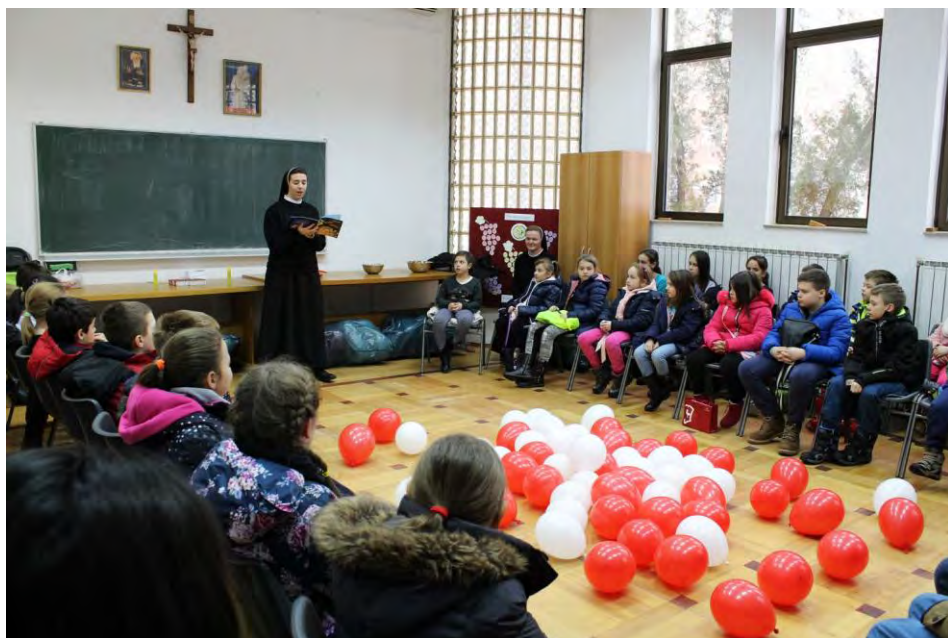
Sestre SMI s prvopričesnicima u župi