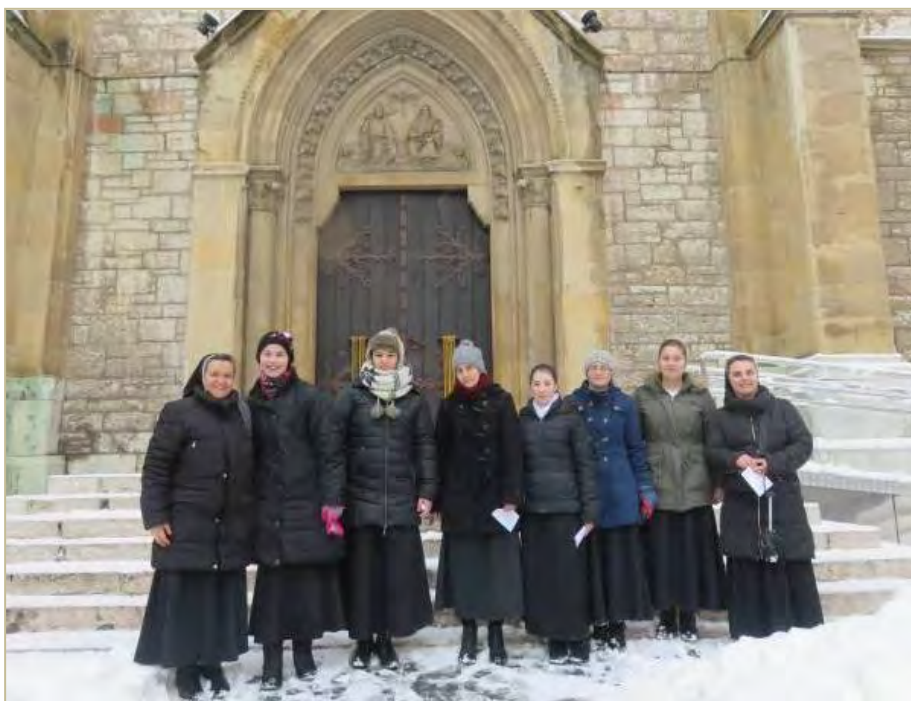
Pripravnice sa sestrama odgojiteljicama ispred Stadlerove katedrale

Ukratko, ovo su naša razmatranja i predavanja o kojima smo razmišljali i meditirali za vrijeme duhovnih vježbi. Imale smo vremena za sve: molitvu, predavanja, igru i sl. Međutim, posebno ću ove duhovne vježbe pamtiti po hodu „Stadlerovim stopama“. Točnije, drugoga dana duhovnih vježbi, nakon jutarnjih predavanja i ručka, kandidatice i sestre su se zaputile prema onim mjestima gdje je nadbiskup Stadler bio za svoga života. To je puno značilo svakoj kandidatici. Iako sam tim mjestima vrlo često prolazila, nikada nisam toliko puno razmišljala o njima. Ali sada kada smo krenule na ta mjesta zbog Stadlera, počela sam itekako razmišljati o Stadlerovim djelima.