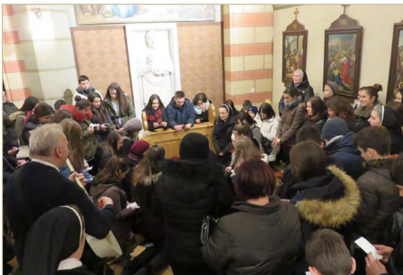
Sestre i Prijatelji Maloga Isusa iz župe Gromiljak u molitvi na grobu sluge Božjega

Spomen na 174. rođendan sluge Božjega nadbiskupa dr. Josipa Stadlera obilježen je 24. siječnja 2017. molitvenom pripremom za večernje euharistijsko slavlje sati u sarajevskoj prvostolnici, gdje počiva tijelo ovog kandidata za oltar. Uz sestre Služavke Maloga Isusa koje djeluju u Sarajevu i djecu Stadlerova dječjeg doma „Egipat“, ovaj spomen na poseban su način obilježili Prijatelji Maloga Isusa i vjernici župe Imena Marijina s Gromiljaka, koji su zajedno sa sestrama Služavkama Maloga Isusa iz istoimene župe hodočastili na grob sluge Božjega. Molitvenu pripravu u 17.30 sati animirale su sestre Služavke Maloga Isusa iz zajednice u Nadbiskupskom ordinarijatu zajedno s Prijateljima Maloga Isusa župe Gromiljak.