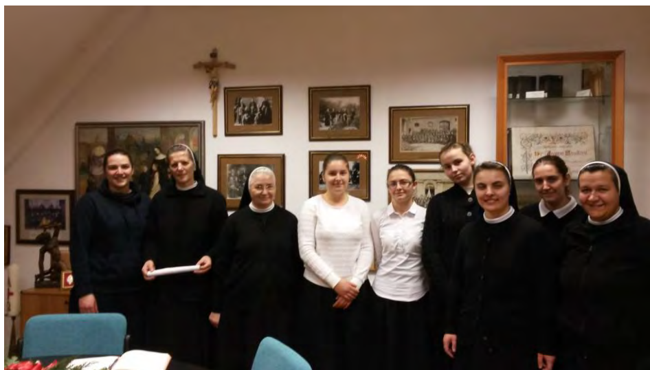
Pripravnice sa sestrama odgojiteljicama u Stadlerovom muzeju