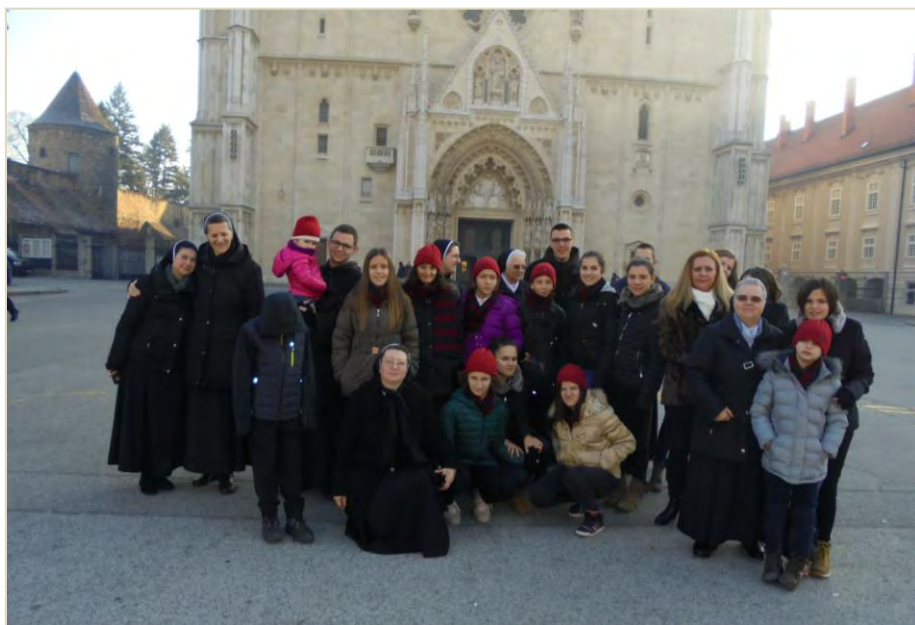
Djeca, sestre i mladi volonteri ispred Zagrebačke katedrale

Nakon zajedničkog doručka u nedjelju, 11. prosinca djeca, sestre i mladi prijatelji pozdravili su se sa sestrama iz Generalne uprave, koje su im otvorile vrata kuće i srca u ovim hladnim danima te se zaputili u zagrebačku prvostolnicu. Sudjelovali su na nedjeljnom misnom slavlju u 10.00 sati, a predvoditelj slavija ih je pozdravio i zaželio im dobrodošlicu u Zagreb u povodu 100. obljetnice dolaska sestara SMI-a u ovaj grad.