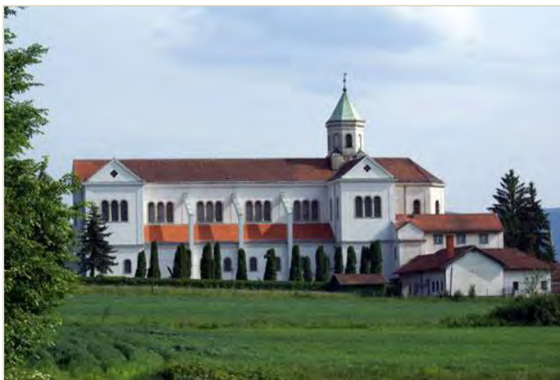
Samostan Marija Zvijezda kod Banja Luke