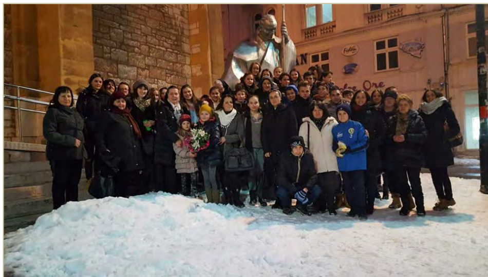
Prijatelji Maloga Isusa i sestre SMI iz župe Gromiljak pred Stadlerovom katedralom

Svanulo je još jedno jutro. Za neke možda obično zimsko jutro. Onako hladno i puno poljubaca. Poljubaca zimskog povjetarca. Međutim, za neke je to nečiji rođendan. Ne dvadeseti, ni trideseti, a ni pedeseti...Već 174. Možda on nije bio tu da proslavi s nama svoj rođendan. Možda ne fizički. Ali u našim srcima definitivno jest. Njegova nazočnost osjetila se kroz građevinu u kojoj smo bili.