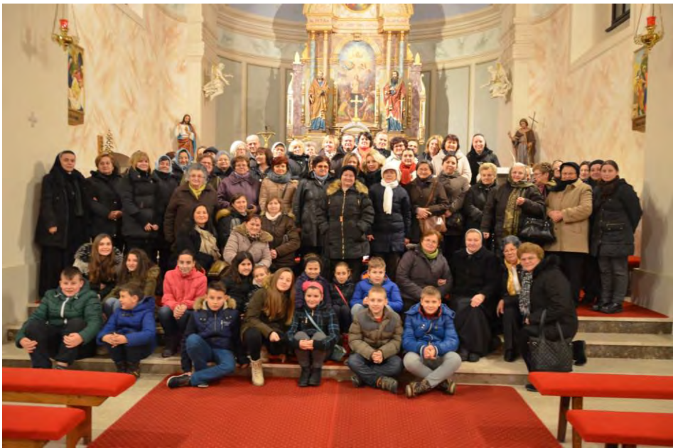
Sestre i Prijatelji Maloga Isusa iz župa Svih Svetih iz Podravskih Sesveta, Sv. Benedikta i Gospe Žalosne iz Kloštra Podravskog i Sv. Vida u Pitomači