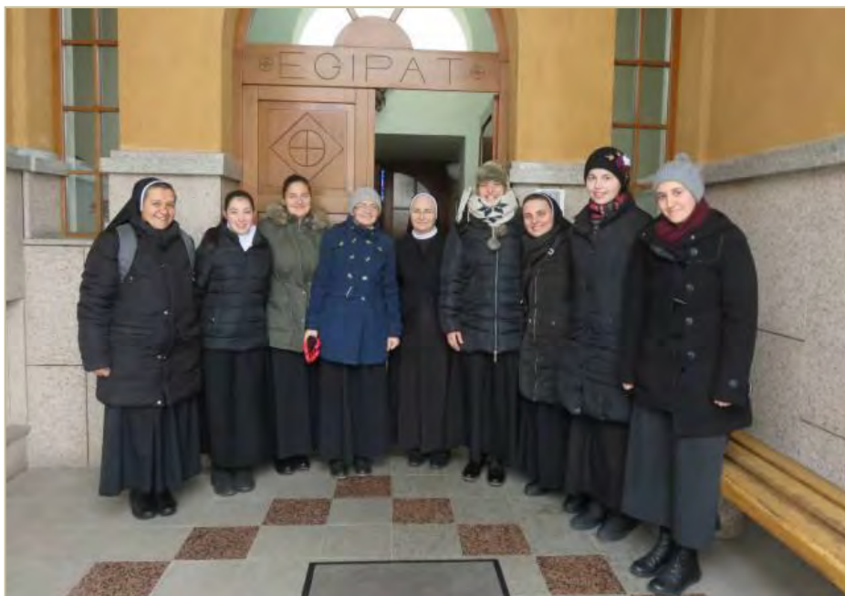
Pripravnice sa sestrama pred Samostanom Egipat