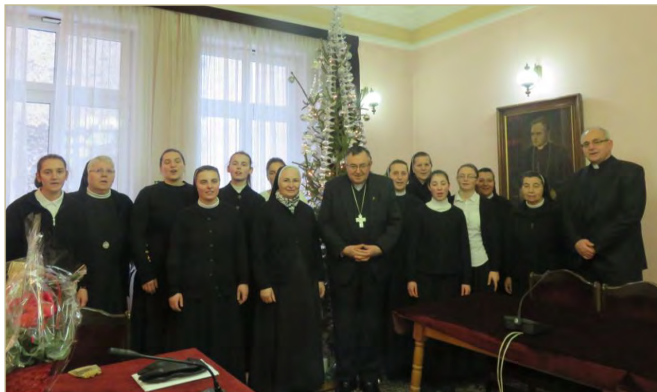
Sestre i pripravnice s mons. Ivom Tomaševićem u posjeti kardinalu Vinku Puljiću

jer je svoju životnu sigurnost stavila u Božje ruke. Duhovnik je nakon toga predvodio pokorničko bogoslužje i imale smo prigodu za ispovijed.