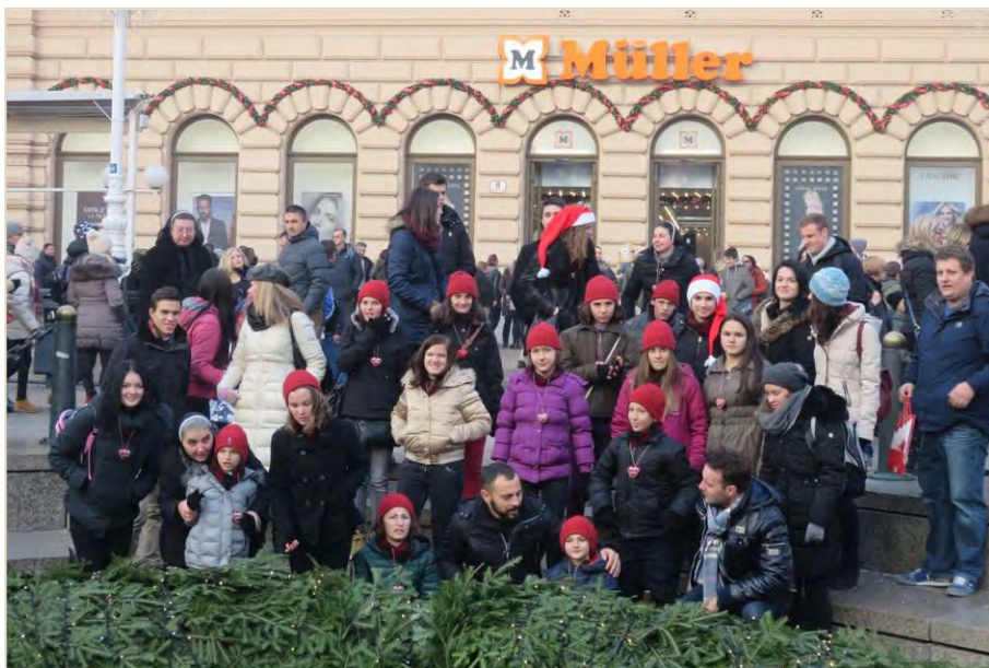
Djeca iz Stadlerovog dječjeg Egipta i sestre SMI s mladima Udruge Prsten

Druga je godina kako Forum mladih udruge „Prsten“ iz Zagreba daruje djecu Stadlerova dječjeg doma „Egipat“ vrijednim darovima za Božić ispunjavajući im želje kroz humanitarnu akciju „Mladi mladima“. Ove su godine djeca dobila i više od zaželenog: dva dana „Adventa u Zagrebu“, nova prijateljstva, mnoštvo darova, nova iskustva od kojih je najsnažnije ono da su voljena i da se Bog, po dobrim ljudima, brine za njih.