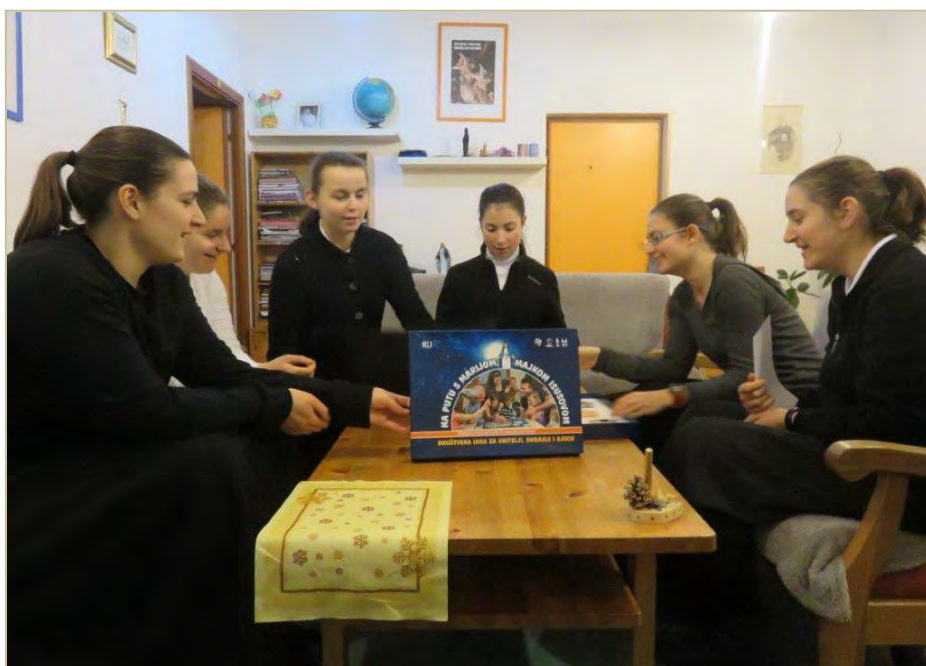
Pripravnice u zajedničkom druženju

Kroz predavanja i razmatranja o Božjoj Riječi, pozivu, vršenju volje Božje, Evanđelju kao zajedničkom vrhovnom mjerilu svih karizmi i Družbi, siromaštvu i ljubavi prema siromasima, pripravnice su sa svojim odgajateljicama imale mogućnost dublje proniknuti u dubine duhovnosti i otkriti ono najvažnije – temelje na kojima valja graditi budućnost.