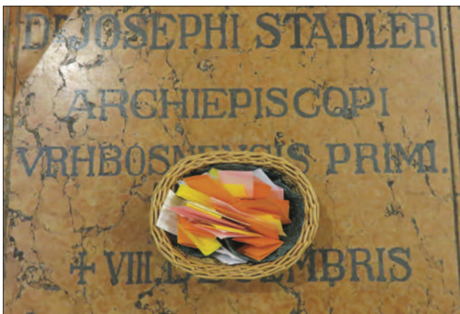
Molitve djece iz Neuma na Stadlerovom grobu

Markovića i katedralnog župnika vlč. Mate Majića. Čitanja pod svetom misom animirale su sestre SMI, a svojom pjesmom i sviranjem slavlje su uveličali bogoslovi VBS-a. Preč. Knežević je u prigodnoj propovijedi u kratkim crtama istaknuo dvije važne riječi Stadlerova upravljanja Vrhbosanskom nadbiskupijom, a to su: činiti i naučavati, riječi koje su potpuno utemeljene na djelovanju samog Isusa Krista. Stadler je činio i naučavao, te poput Isusa imao sažaljenja, suosjećanja s napaćenim narodom i bio im pravi pastir. Završavajući propo-