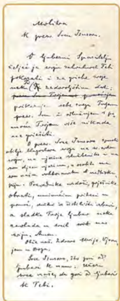
Faksimil molitve Sluge Božjeg Josipa Stadlera