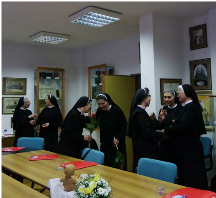
Radujemo se s vama drage sestre